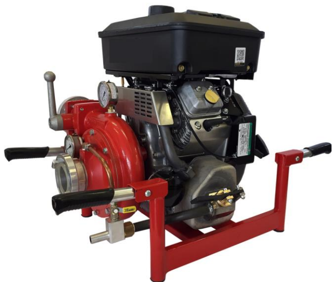
Delta Fire-fighting pump