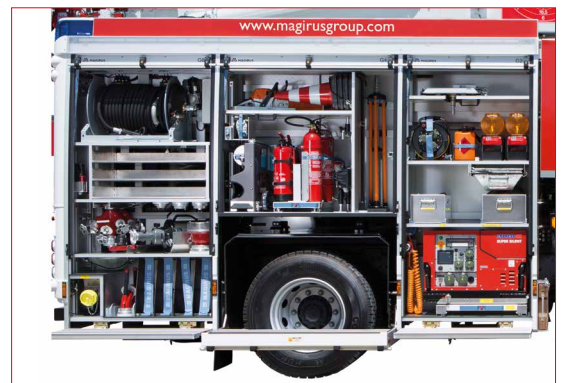
Accessoires (exemple d'aménagement)