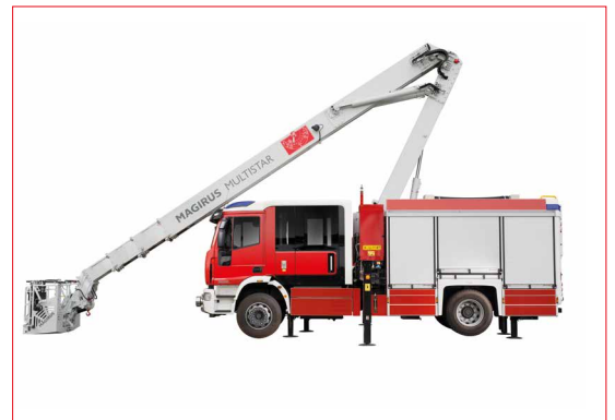
Bras télescopique avec plage de fonctionnement de -12m à +30,5m

Les images peuvent inclure des options supplémentaires. Toutes modifications techniques ou améliorations sont susceptibles d'être faites à tout moment sans notifications écrites. Photos non contractuelles